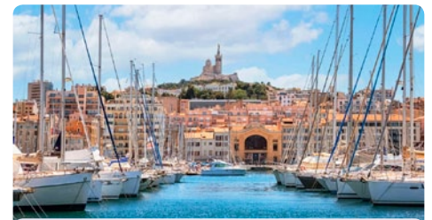
Marseille • Frankreich