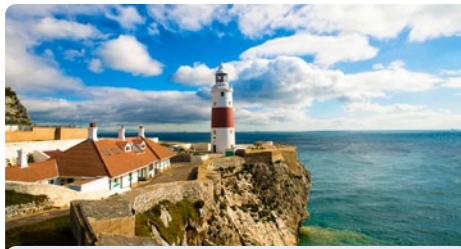
Gibraltar • Großbritannien