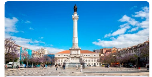
Lissabon • Portugal