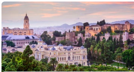
Málaga • Spanien