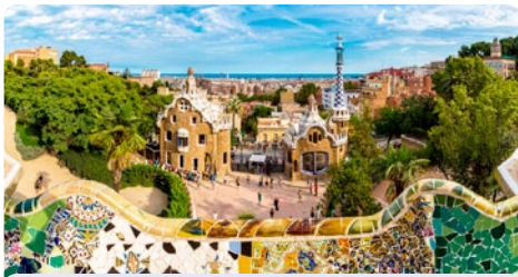
Barcelona • Spanien

Tanze über das Mittelmeer und den Atlantik – erlebe magische Orte!