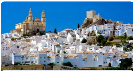
Cádiz • Spanien