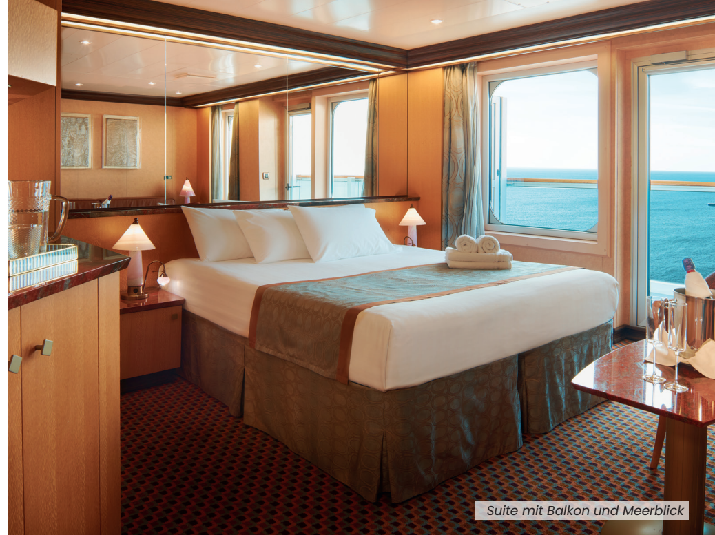
Suite mit Balkon und Meerblick