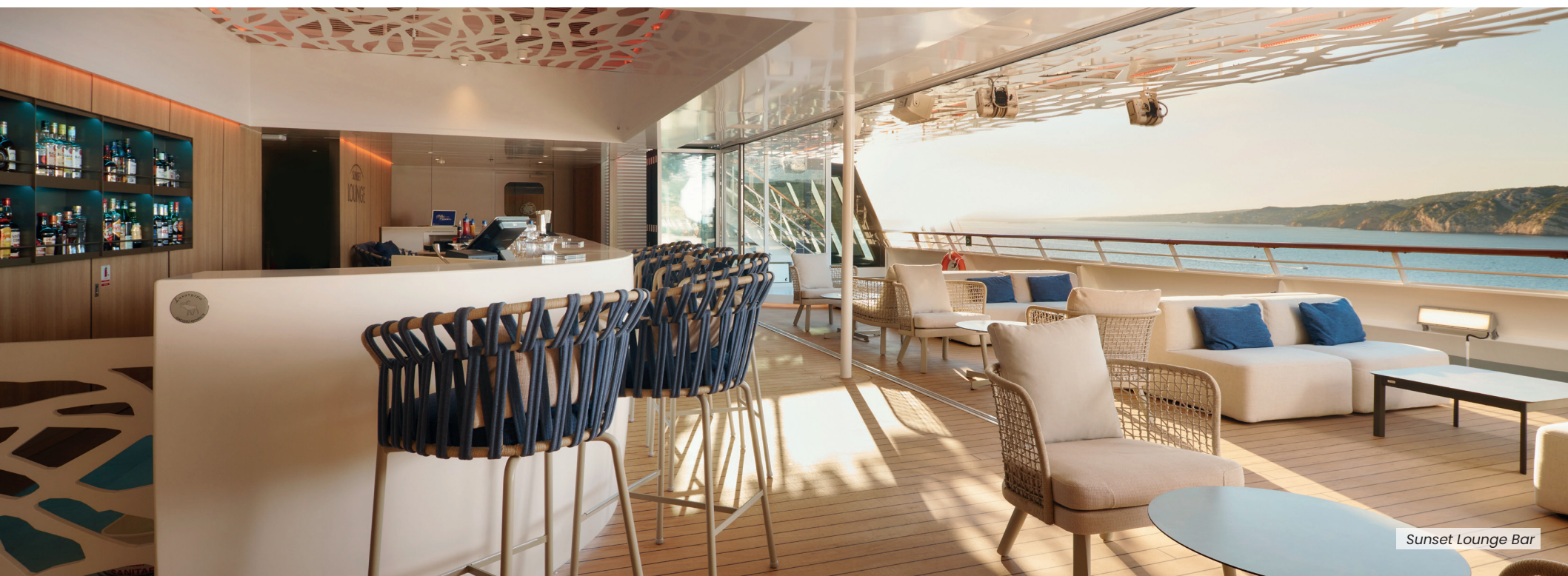
Sunset Lounge Bar