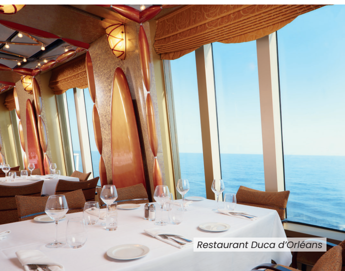
Restaurant Duca d'Orléans

• 9 Restaurantsi, darunter 5 Themenrestaurants: das Restaurant Archipelago, das Teppanyaki, das Sushino at Costa, die Pizzeria Pummid'Oro, das The Salty Beach Street Food (Themenrestaurants gegen Gebühr und z.T. mit Reservierung) • 9 Bars, davon 4 Themenbars: die Aperol Spritz Bar, die Sunset Bar, die Wine Bar und die Gelateria Amarillo.