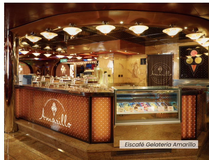
Eiscafé Gelateria Amarillo

• Theater über 3 Decks • Casino • Diskothek • Pooldeck mit ausfahrbarem Glasdach und Riesen-Kinoleinwand • Toboga- Wasserrutsche • Shopping Galerie • Arcade Video Bereich • Bereich für Familien mit Kindern bis 6 Jahren • Squok-Kinderclub für 3 bis 11-jährige Kinder.